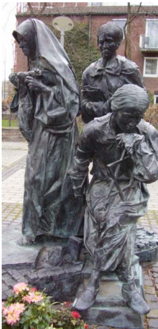
Bert Gerresheim: Egy szent csoportképe, 1999. (Az Edith Stein három életszakaszát ábrázoló kölni emlékmű)

„Isten gyermekének lenni azt jelenti: legyünk kicsinyek és ez által nagyok; lépjunk ki saját életünk szűk világából, és álljunk be a keresztény élet sodrába.”