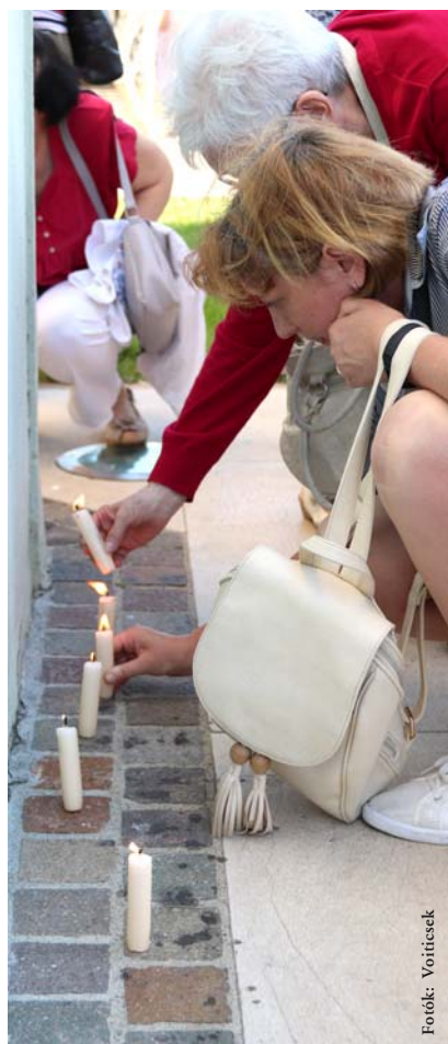
2019. június 10. Pünkösdhétfői gyertyagyújtás a Szent László-templom falainál