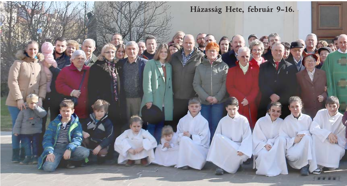
Házasság Hete, február 9-16.