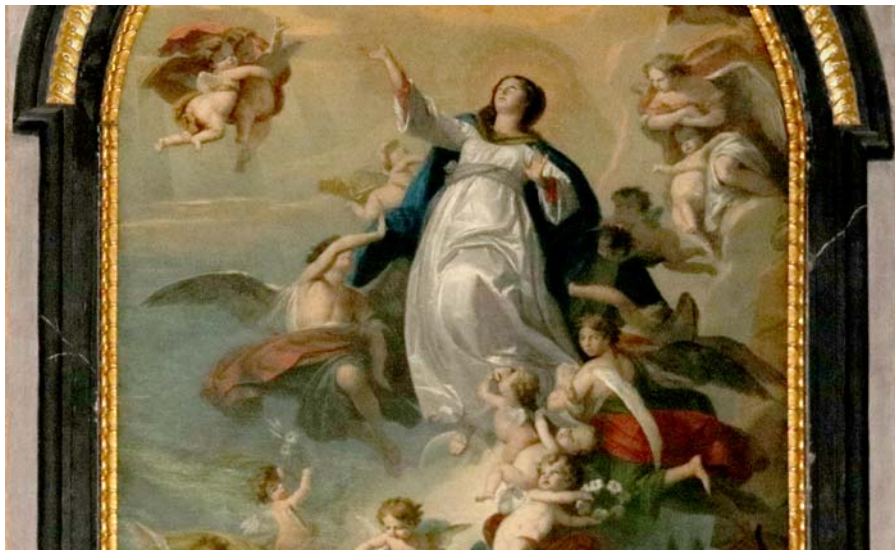
A nagyváradi székesegyház főoltára – részlet

Amikor 1092-ben a kunok, a Szent István által alapított bihari püspökséget feldúlták a földvárban lévő összes tartozékaival együtt, László, mint apostoli