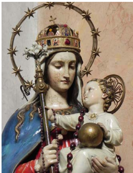
Mária-szobor a zilahi plébániatemplomban

- A leírtakból világosan kitűnik, hogy a magyar nép kezdetől fogva Mária népe, hazánk Mária országa, a „Regnum Marianum” és, hogy azzá lett, azt első szent királyainknak, Szent Istvánnak és Szent Lászlónak köszönhetjük. Világosan kitűnik a Szent Gellért-legendából is, amikor a püspök hallja az éjszaka csendjében dolgozó parasztember máriás énekét, megkérdezi titkárától: milyen ének ez? A titkár azt válaszolja, nagyon találóan: a magyarok szimfóniája! Legyünk mindnyájan ilyen szimfónia éneklők!