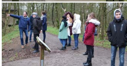
Zwillbrock, biológiai állomás