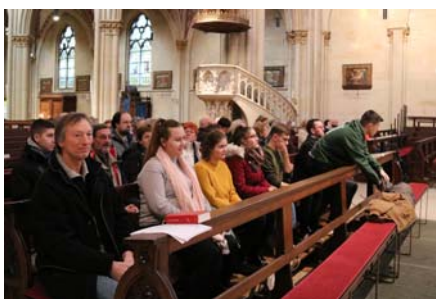
A billerbecki dómban