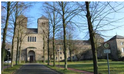
Gerleve, bencés apátság