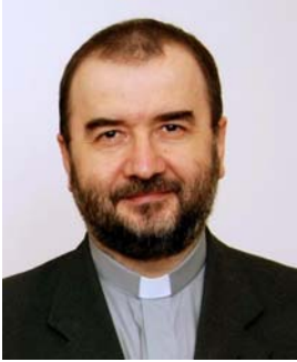
Exc. Kovács Gergely kinevezett gyulafehérvári érsek

Ferenc pápa 2019. december 24-én nevezte ki gyulafehérvári érsekké Kovács Gergelyt, a Kultúra Pápai Tanácsának irodavezetőjét. A püspökszentelést és érseki beiktatást február 22-én ünneplik Gyulafehérváron.