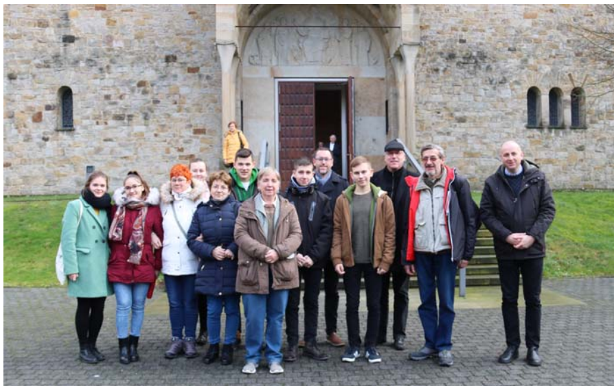
Csoportunk a bencés apátság előtt

ünnepeltük, majd továbbutaztunk Zwillbrockba, ahol a biológiai állomáson látványos kiállítás mutatja be a vidék természeti adottságait. A természetvédelmi terület különleges látványossága az évente visszatérő flamingó kolónia. Egy kiadós séta előtt betértünk a barokk templomba egy imára. Este a vredenai gimnázium tanulóinak színvonalas matinéműsorát tekintettük meg.