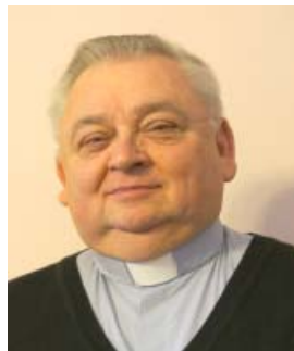
Mons. Fodor József általános helynök

Az idei évben február 23–24–25-én tartjuk templomunkban a triduumot, amelyre Mons. Fodor József általános helynököt hívtuk meg. A program mindhárom nap hasonlóan zajlik: délután 4 órától szentségimádás, 5 órától szentmise. Minden kedves testvérünket szeretettel meghívunk és várunk a közös imádságra és szentmiseáldozatra.