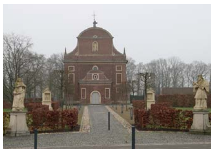
Zwillbrock, barokk templom