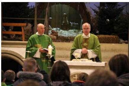
Szentmise a vredeni kolostortemplomban