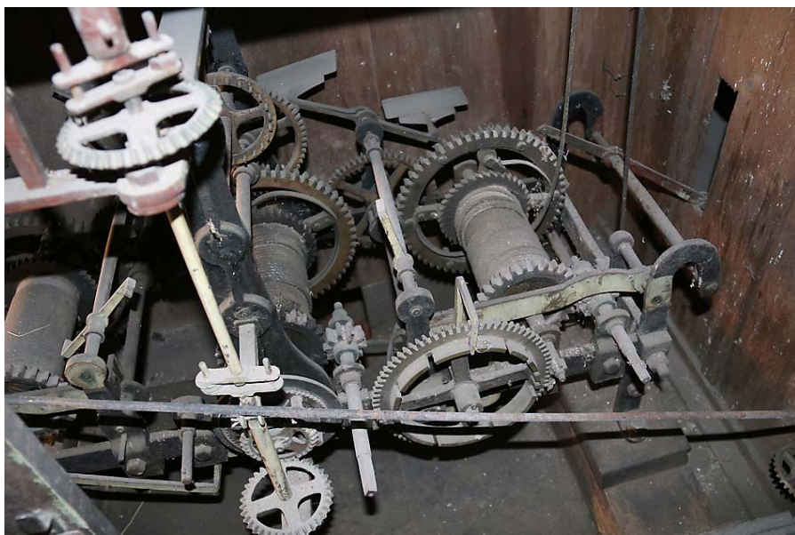
A régi óraszerkezet

szerkezetet, az óramutatókkal és táblákkal, súlyokkal, kötelekkel együtt. A régi óraszerkezetre Dadayhoz hasonlóan ő is igényt tartott. (...)